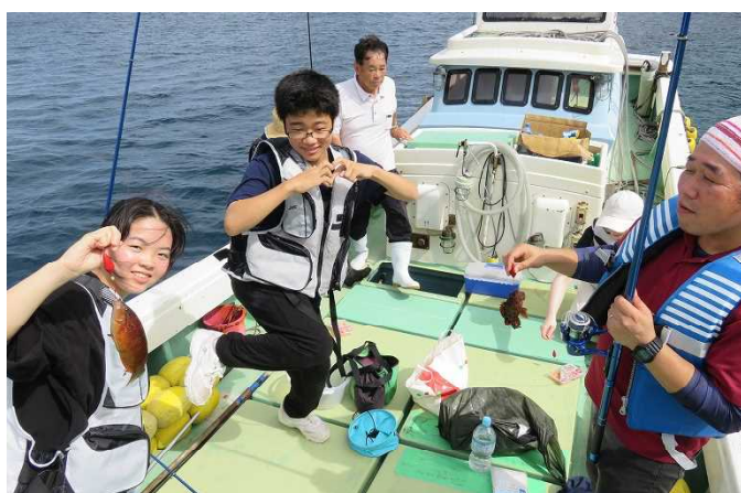
海の会では、船釣りを楽しんだ後に、スイカ割りをしました。