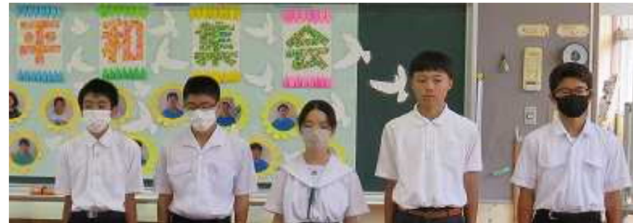
被爆体験講話、修学旅行での遺構巡りを元に、平和について調べ学習を行い、平和集会で発表しました。