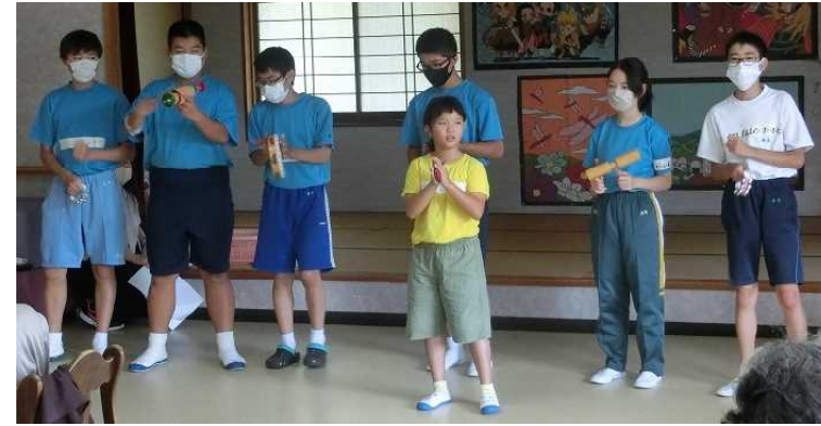
小学生の出し物の手伝い